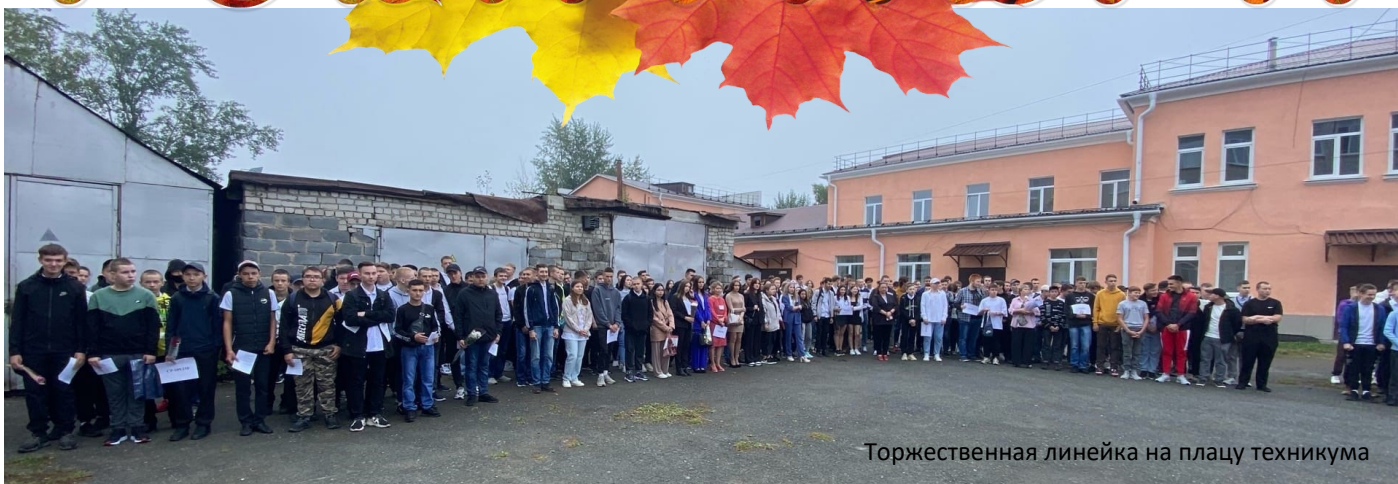
Торжественная линейка на плацу техникума