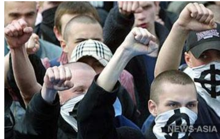
В Костроме скинхеды напали на неформалов