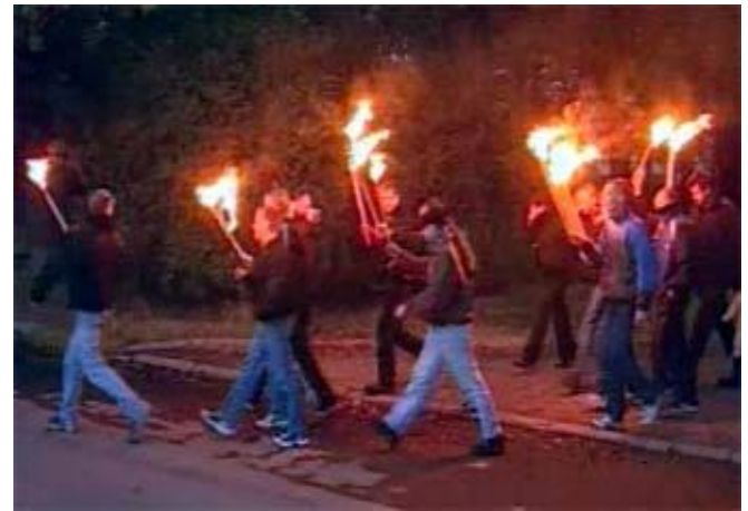
Скинхеды. Факельное шествие в Петербурге.